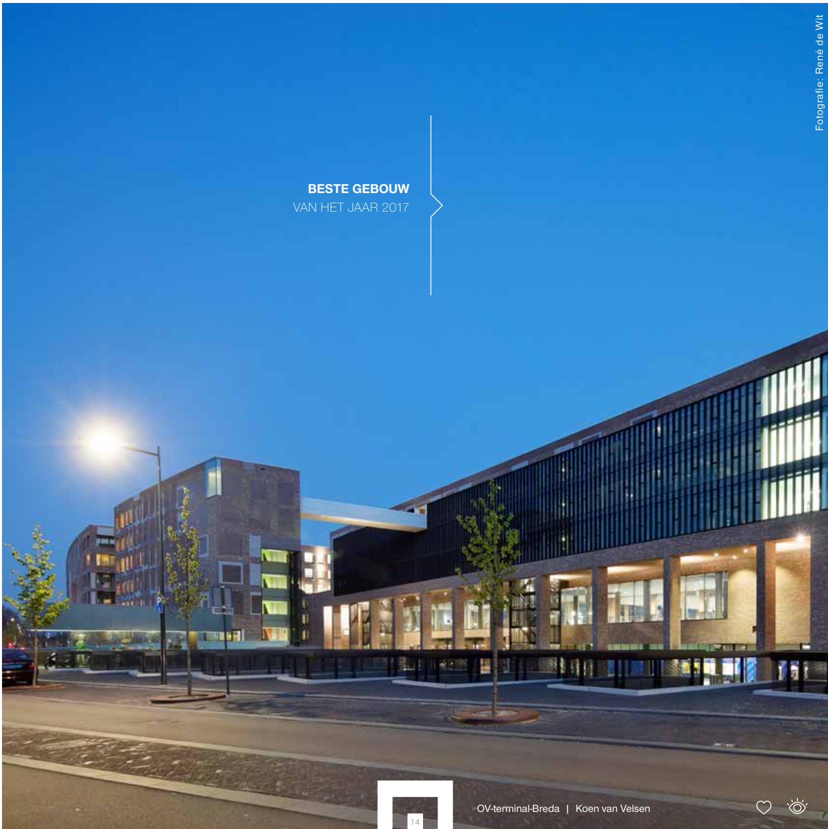
OV-terminal-Breda | Koen van Velsen