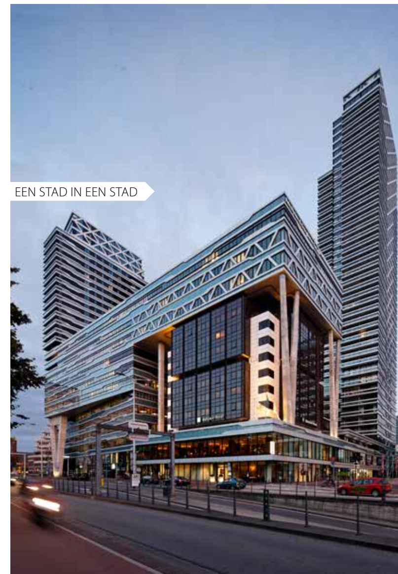
EEN STAD IN EEN STAD